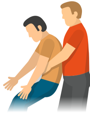
Person ggf. aus dem Gefahrenbereich retten